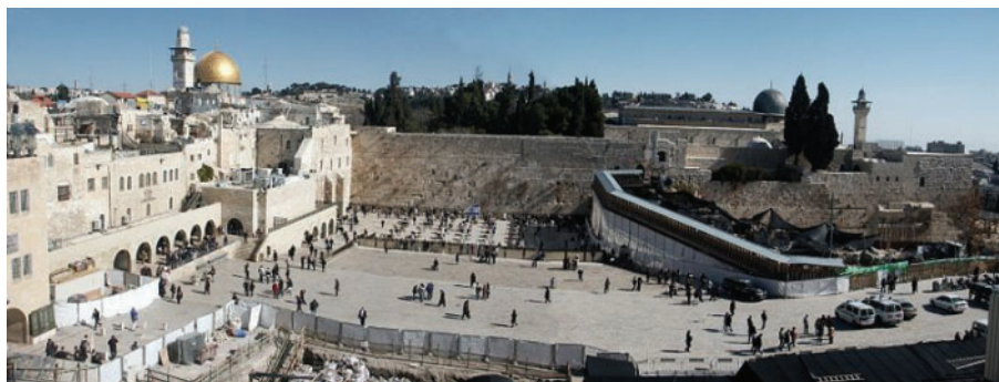
Panorama du Mur occidental surmonté du dôme du Rocher et de la mosquée al-Aqsa

fitna . Le mot signifie d'abord la tentation de l'âme, celle notamment dont use le Diable pour pervertir l'âme ; mais il désigne aussi la pire forme de la désunion, la discorde, les luttes fratricides, bref toute forme de haine qui voue une société à la destruction. Le double sens du mot est révélateur, la seconde acception est la conséquence naturelle de la première. Avant, si l'on peut dire, de déverser son poison à l'extérieur, dans l'espace public, la discorde naît d'abord à l'intérieur même de l'homme, lorsqu'il acquiesce complaisamment aux séductions de celui qui est, la Révélation le répète à plusieurs reprises, son « ennemi déclaré », parce qu'il le divise (Cor. XLI, 36). Aussi n'est-il pas surprenant que le Coran ajoute que, « la fitna est pire que le meurtre » (II, 191). L'affirmation ne concerne pas une communauté particulière, elle a donc valeur de vérité générale. Contre ce mal insidieux dissimulé dans les sociétés, le dialogue n'est-il pas l'arme par excellence ? Dialoguer, par le fait je découvre ainsi l'autre tel qu'il est, désarme la méfiance naturelle qu'il m'arrive d'éprouver instinctivement vis-à-vis d'un inconnu ; or « certaines soupçons sont des péchés » (XLIX, 12). Dialoguer, c'est donner un contenu réel au « vivre ensemble », expression heureuse à condition qu'elle ne soit pas un simple synonyme d'une banale « coexistence », que le mot « ensemble » compte en définitive plus que « vivre ».