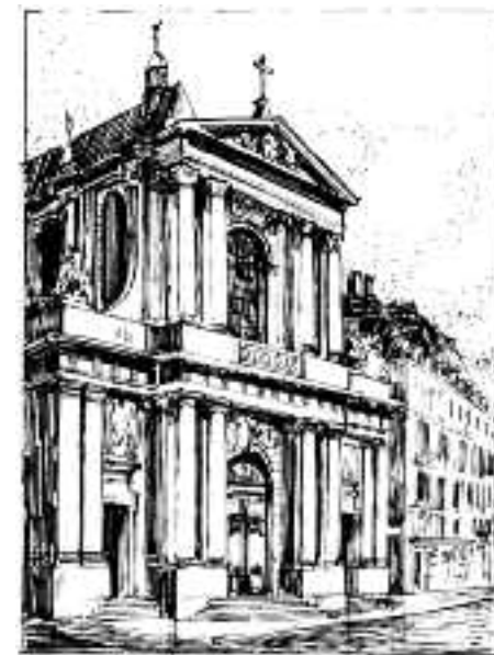
Seule la façade du temple sera restaurée au cours du second semestre 2009