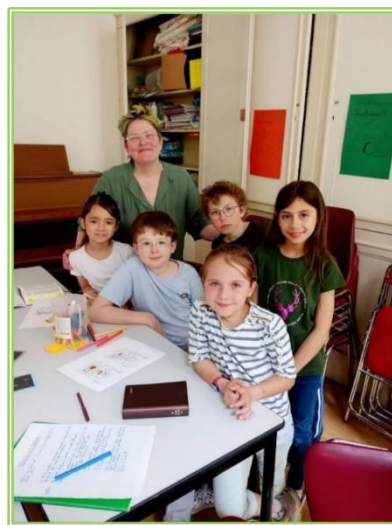
Les témoins et les apôtres