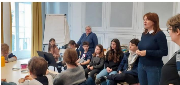
Le débat en plénière avant le vote

Certains d'entre eux, baptisés dans les premiers mois de leur vie, ont exprimé un regret à ce sujet. Ils ont été rassurés d'apprendre qu'ils pourraient faire le choix de confirmer (ou pas...) leur baptême vers l'âge de 15 ans, à l'issue du catéchuménat.