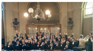
Une joyeuse assemblée de théologiens et théologiennes !

Mais tous sont tombés d'accord sur un point, c'est Dieu qui a envoyé Jésus, son fils, et en lui, il a mis sa joie. Qu'elle guide nos cœurs !