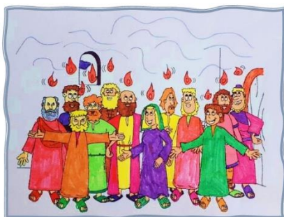
Coloriage par les enfants de l'Education Biblique de l'Oratoire, Paris, mai 2024.