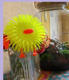
Encore et toujours... Notre meilleur ami Barnabé!